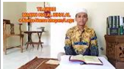
REFERENSI TAUSIAH HALAL BI HALAL MUFLIS